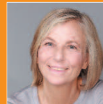
Marielle DE SARNEZ ILE-DE-FRANCE